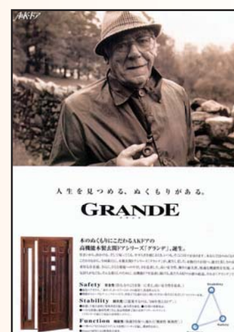
玄関ドア グランデ