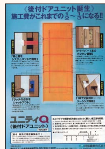
後付ドアユニット