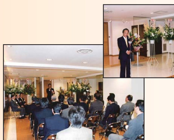
A & K ショールームリニューアル