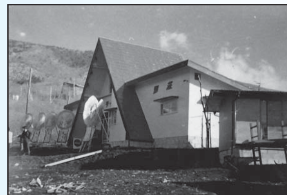
会員制別荘クラブ