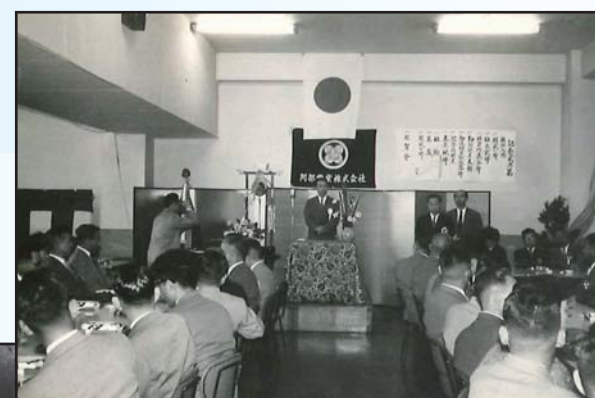
創業 15 周年式典