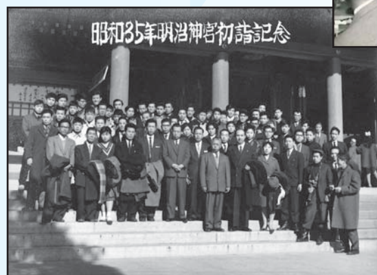
昭和 35 年初詣